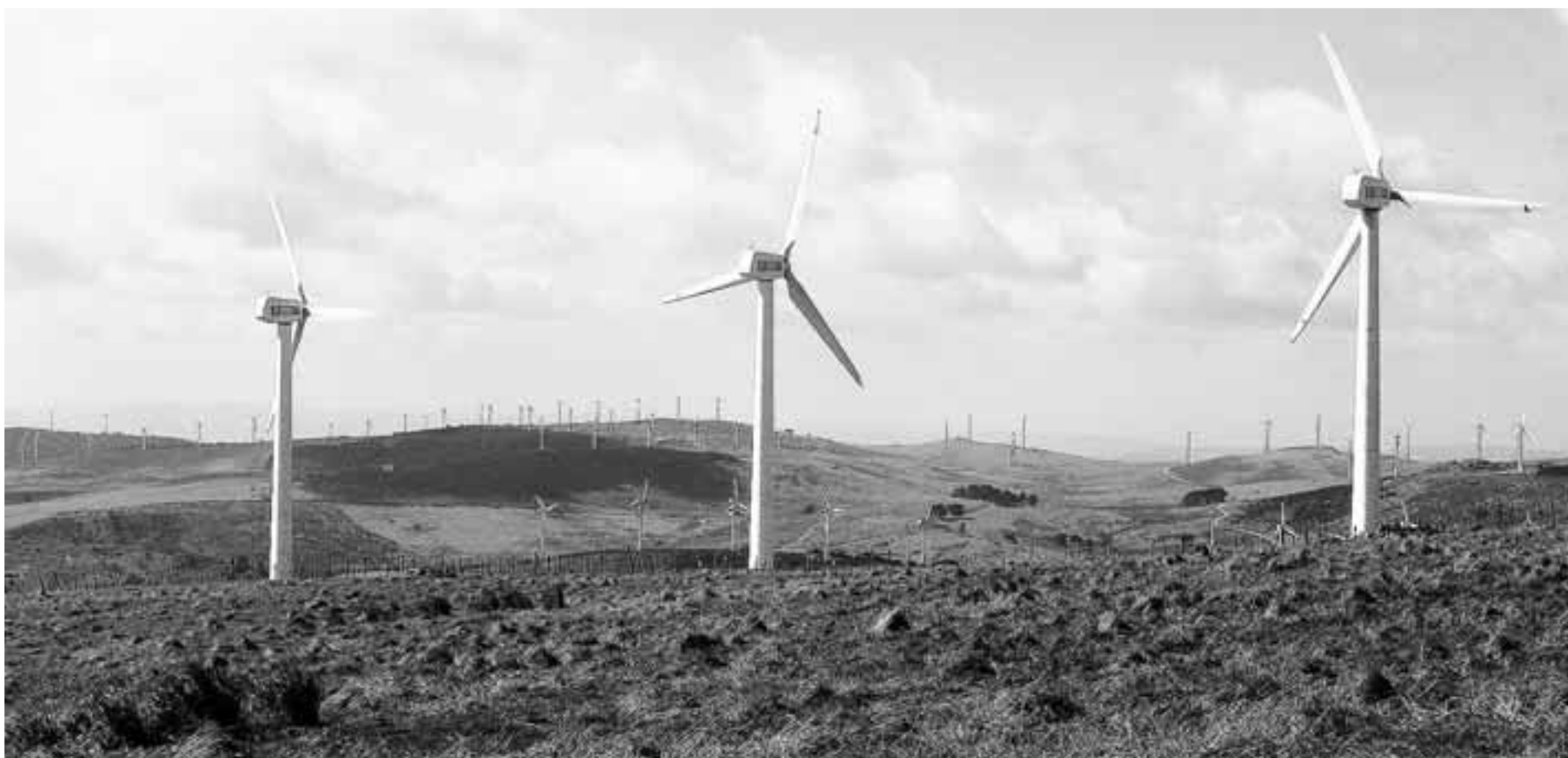
Imagen de un parque eólico valenciano.